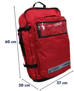
Sac de secours Grimm Compact 60x37x30cm