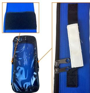
Sac oxygénothérapie avec poche DAE 68x29x24cm