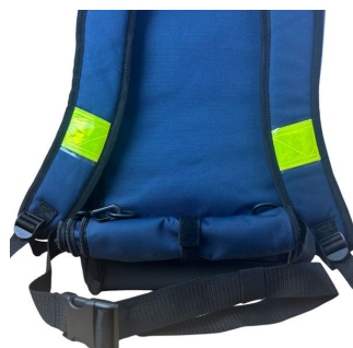
Sac oxygénothérapie avec poche DAE 68x29x24cm