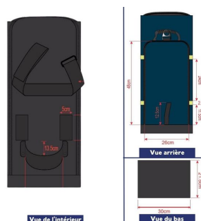
Sac oxygénothérapie avec poche DAE 68x29x24cm