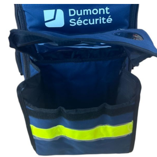
Sac oxygénothérapie avec poche DAE 68x29x24cm