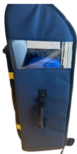
Sac oxygénothérapie avec poche DAE 68x29x24cm