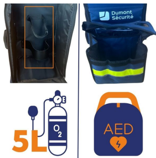
Sac oxygénothérapie avec poche DAE 68x29x24cm