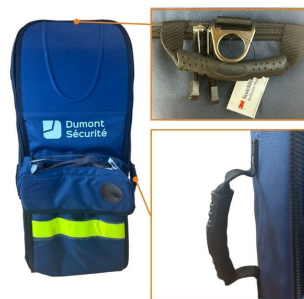
Sac oxygénothérapie avec poche DAE 68x29x24cm