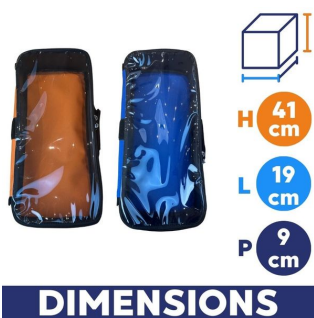
dimension Pochettes de rangement amovibles pour sac premiers secours