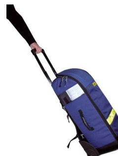
Sac oxygénothérapie avec poche DAE 68x29x24cm