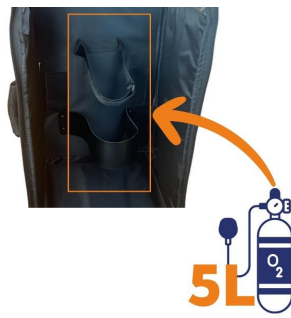
Sac oxygénothérapie avec poche DAE 68x29x24cm