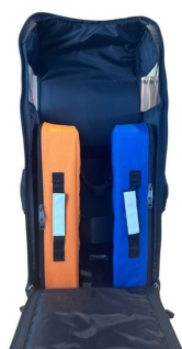
Sac oxygénothérapie avec poche DAE 68x29x24cm