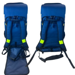
Sac oxygénothérapie avec poche DAE 68x29x24cm