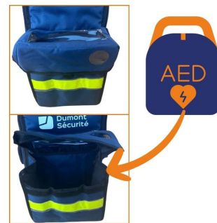
Sac oxygénothérapie avec poche DAE 68x29x24cm