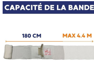
Pansement israélien compressif stérile First Care Blanc