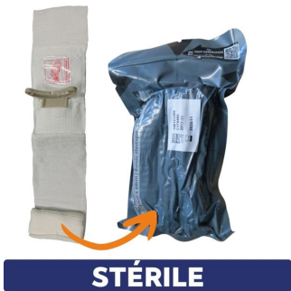
conditionnement du pansement israélien compressif stérile