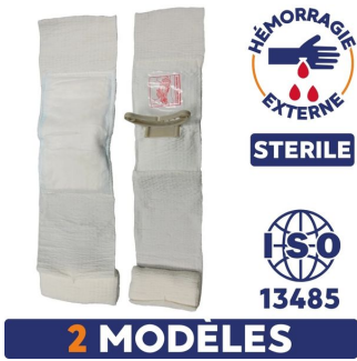
Pansement israélien compressif stérile First Care Blanc