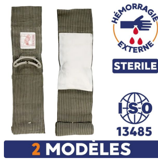
pansement compressif version militaire stérile pour hémorragie externe certifié iso13485 disponibles en 2 modèles