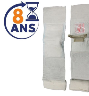
Pansement israélien compressif stérile First Care Blanc