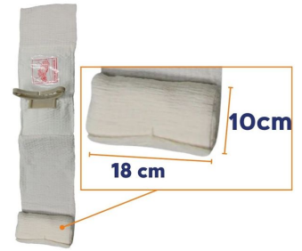
Pansement israélien compressif stérile First Care Blanc