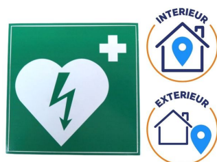
emplacement intérieur et extérieur signalétique dae