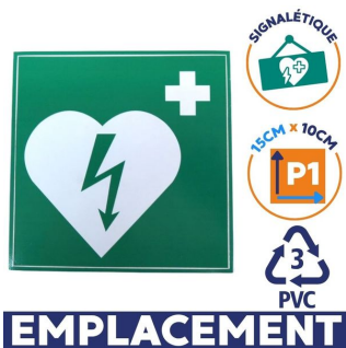
Panneau défibrillateur 10 x 15 cm pvc signalétique emplacement dae