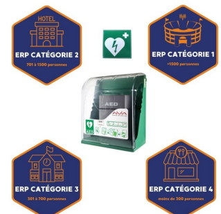
obligation erp signalétique et boîtier défibrillateur