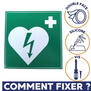
comment fixer un panneau défibrillateur ? double face, silicone et vis