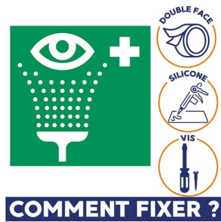
comment fixer Panneau de signalisation