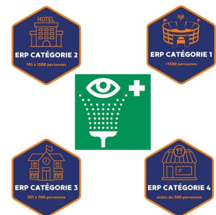
Station rince oeil Panneau de signalisation