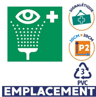
Station rince oeil Panneau de signalisation p2 pvc