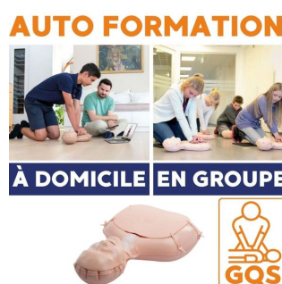
formation gqs à domicil et en groupe mannequin laerdal