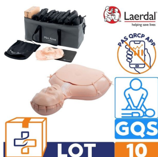
lot de 10 mannequin de formation gqs laerdal