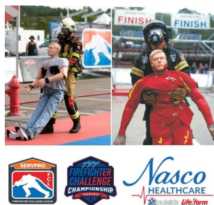
entrainement pompier : nasco healthcare marque de référence