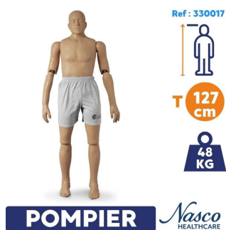
Mannequin sauvetage et entrainement pompier Rescue Randy : 48 kg et 127cm