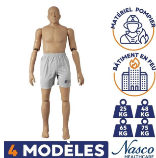
Mannequin sauvetage : matériel pompier pour entrainement sauvetage bâtiment en feu 4 modèles nasco healthcare