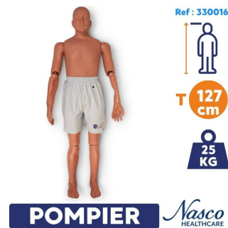
Mannequin sauvetage et entrainement pompier Rescue Randy 25kg et 127cm