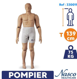
Mannequin sauvetage et entrainement pompier Rescue Randy : 75 kg et 139 cm