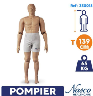
Mannequin sauvetage et entrainement pompier Rescue Randy : 65 kg et 139 cm