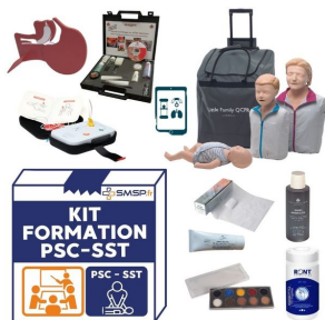
Kit de formation secourisme composition