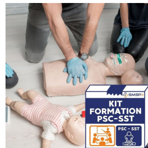
formation psc kit de formation complet