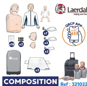
mannequin secourisme laerdal composition du pack avec application grcp