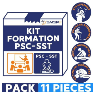
Kit de formation PSC1 et sst composé de 11 pièces pour formation étouffement, saignement, victime inconsciente, victime ne respire pas