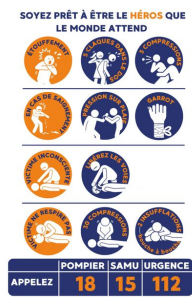
Kit de formation PSC1 - SST