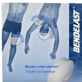
Filet tubulaire de maintien - 50 m