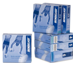
Filet tubulaire de maintien - 50 m