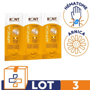
lingette anti-inflammatoire arnica pour hématomes