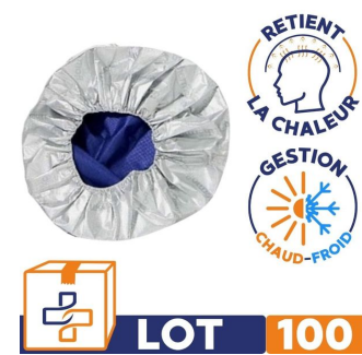
lot de 100 Charlotte thermique adulte qui retient la chaleur corporelle pour gestion chaud et froid