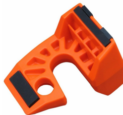
Bloque porte cale Porte Wedge-it