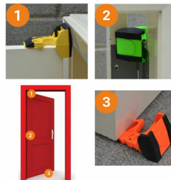
Bloque porte cale Porte Wedge-it