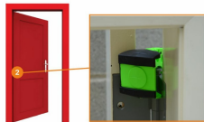
Bloque porte cale Porte Wedge-it