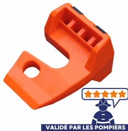
Bloque porte cale Porte Wedge-it