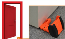
Bloque porte cale Porte Wedge-it