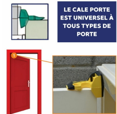
Bloque porte cale Porte Wedge-it