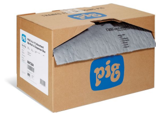
Tapis multi-usages Absorbant Universel