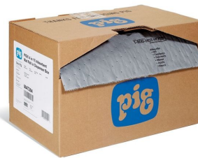
Tapis multi-usages Absorbant Universel