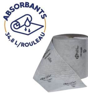
Tapis multi-usages Absorbant Universel