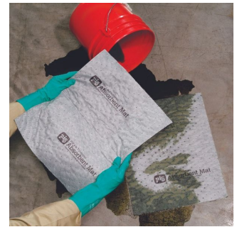
Tapis multi-usages Absorbant Universel