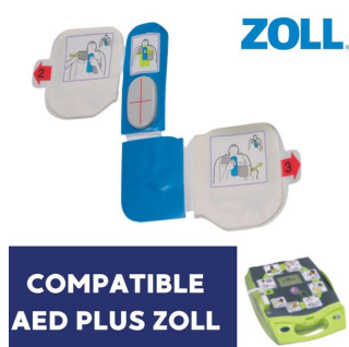
Electrode défibrillateur adulte CPRD AED Plus Zoll