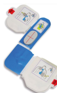
Electrode défibrillateur adulte CPRD AED Plus Zoll