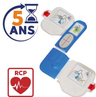
Electrode défibrillateur adulte CPRD AED Plus Zoll