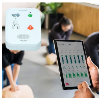
application qrcp pour défibrillateur de formation laerdal