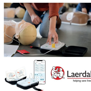
défibrillateur de formation laerdal