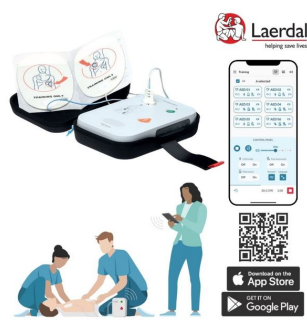
application qrcp pour formation au défibrillateur laerdal