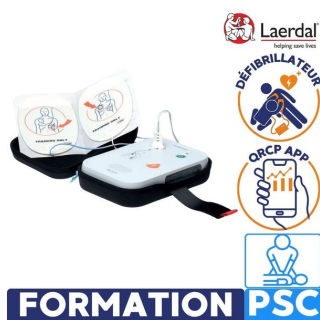
formation au défibrillateur laerdal psc