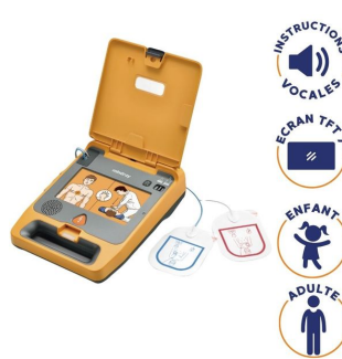
défibrillateur enfant et adulte avec intruction vocal et ecran tft7