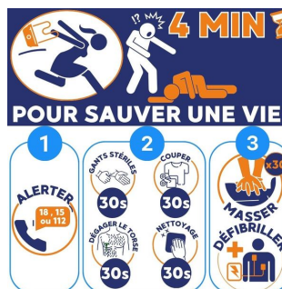
arrêt cardiaque 4 min pour sauver une vie