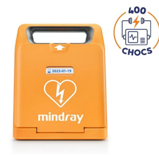
durée de vie défibrillateur mindray