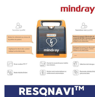
technologie intelligente mindray resqnavi défibrillateur