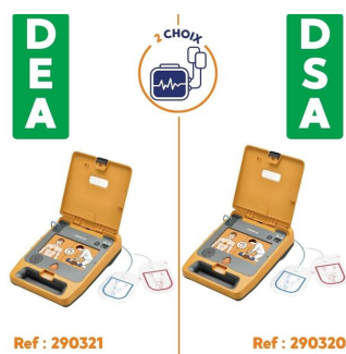
défibrillateur automatique et semi- automatique mindray