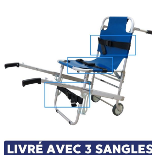
chaise portoir avec 3 sangles