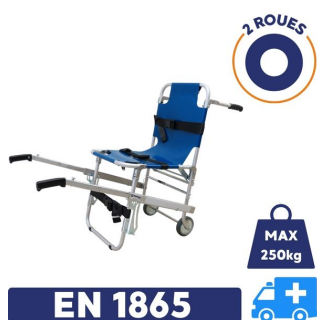
chaise portoir en 1865 avec 2 roues et charge maximum de 250kg