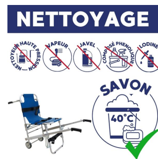
nettoyage de la chaise portoir